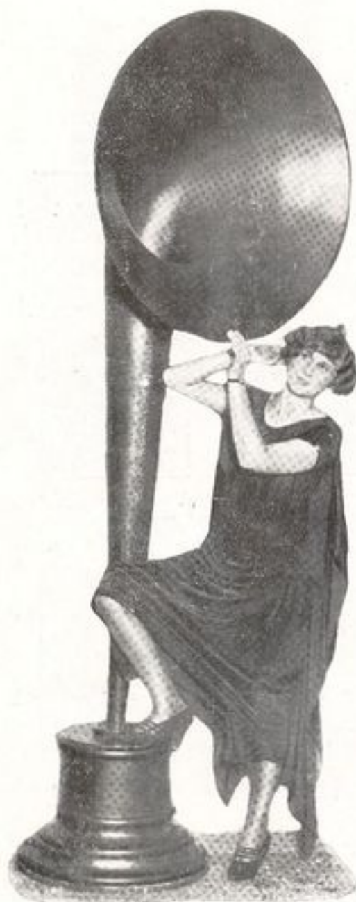
Un gigantesco altavoz, cuya potencia y fidelidad de reproducción fué la admiración de los visitantes de la última feria de T. S. H. celebrada en New York.

El día 6 del corriente a las once de la mañana, tuvo lugar la inauguración oficial de la Exposición de la T. S. H., cinema y electricidad en sus aplicaciones prácticas e industriales, que actualmente se celebra en el Palacio del Hielo.