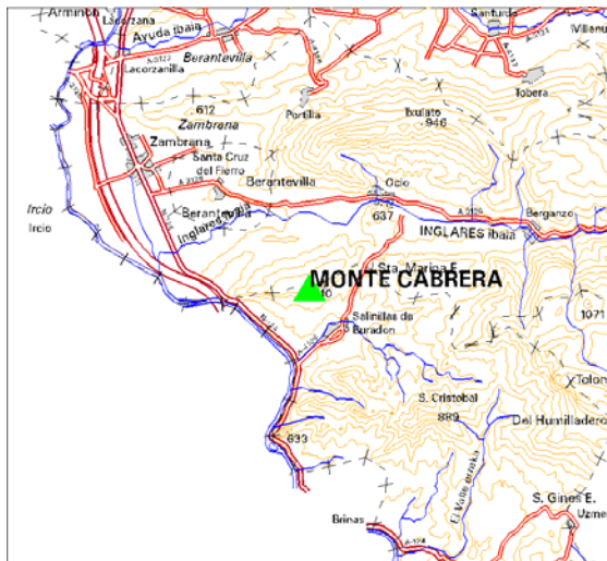
MAPA DE SITUACIÓN 1:150.000