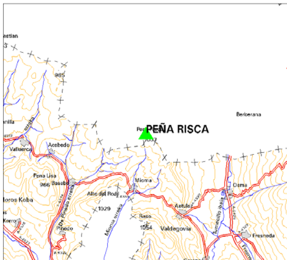
MAPA DE SITUACIÓN 1:150.000