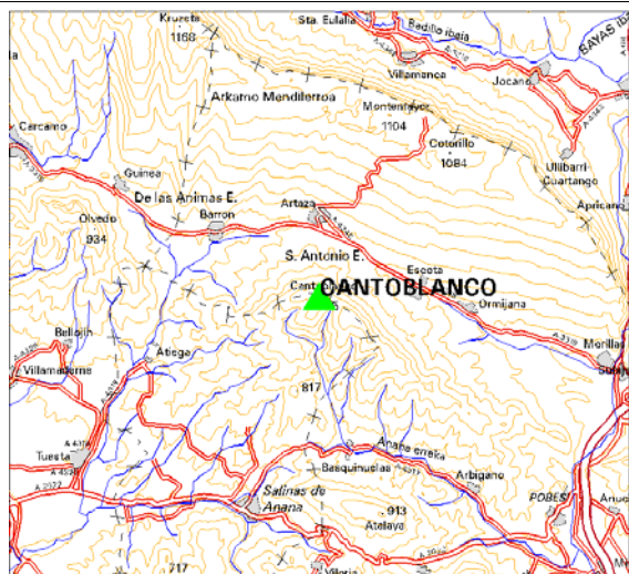
MAPA DE SITUACIÓN 1:150.000