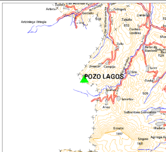
MAPA DE SITUACIÓN 1:150.000