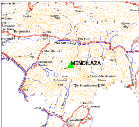
MAPA DE SITUACIÓN 1:150.000