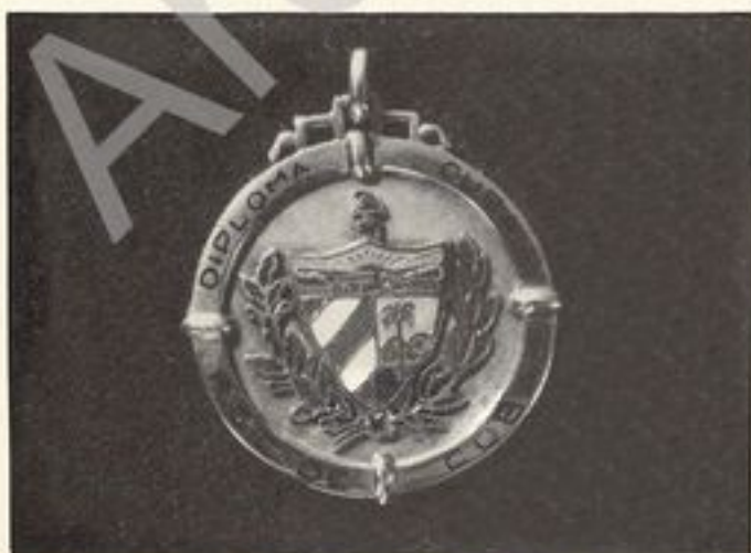
Medalla de Oro del Radio Club Cuba.