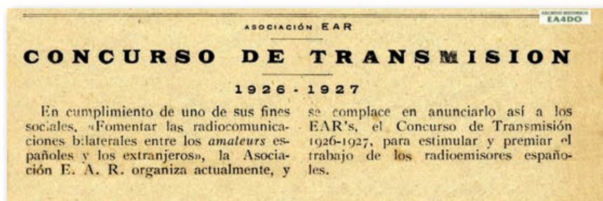
Notificación de la creación del Concurso de Transmisión publicado en el boletín EAR de 1º de julio de 1926.

Pero no solo los comentarios sobre los "indicativos de escuchas" surgieron de